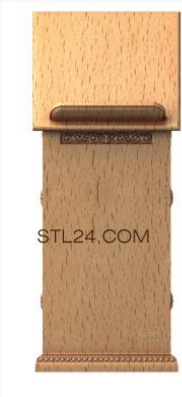
базовая 3д модель аналя, sti ANL 0006 3500₽ →