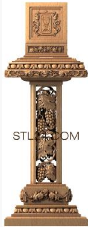
резной аналой - 3д модель в stl формате, виноградная гроздь