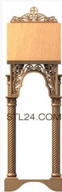
3d stl модель аналя ANL 0008 4500₽ →