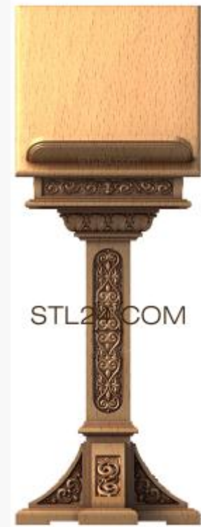
3d stl модель аналая, для изготовления на ЧПУ ANL 0003 4500₽ →