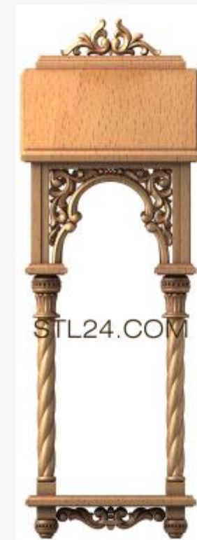
резной аналой - 3д модель в stl формате ANL 0007 4500₽ →